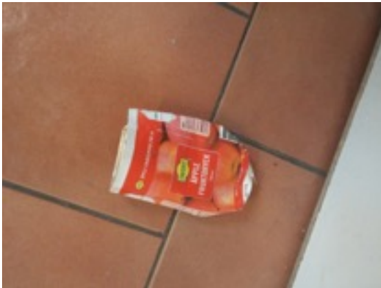
Bild 3. Skräp.