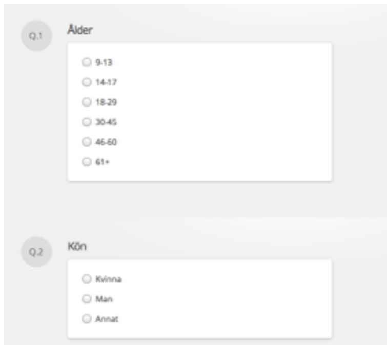
Bild 1. Fråga 1 och 2.