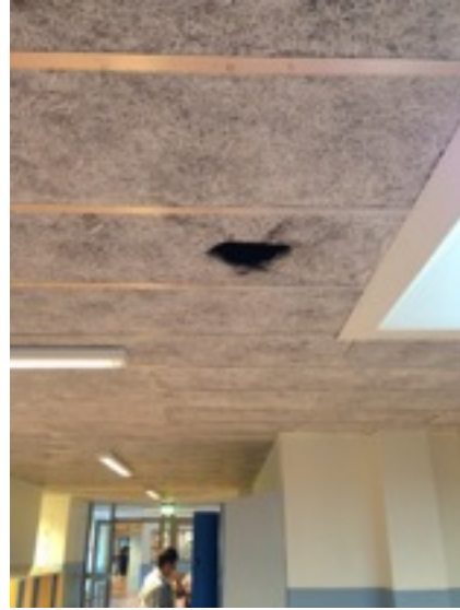
Bild 5. Försörd. Grov.