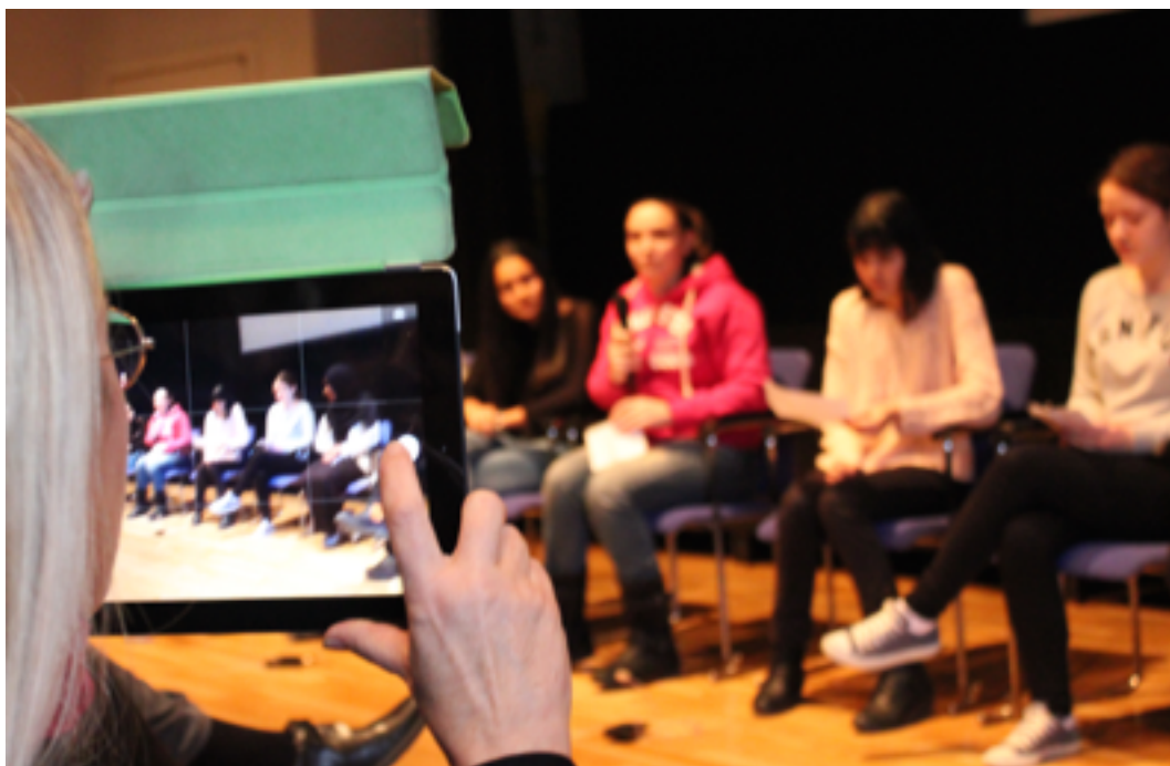
Från Tekniska museet, 2014 11 18.

Att lyssna på barn och ungdomar är viktigt och givande!