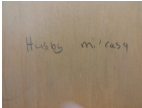
Bild 2. Klotter.