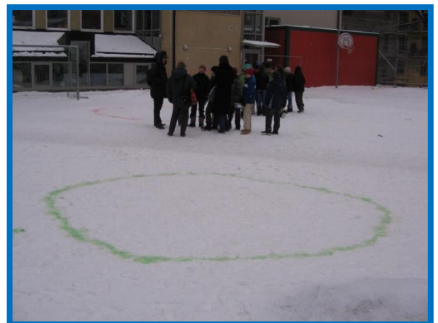
Pidagen 2006 på Eiraskolan.

https://websurvey.textalk.se/start.php?ID=52215