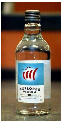
Fig. 3: Fotografi av Explorer-vodka

Uppseendeväckande historiska händelser kräver enligt mitt tycke uppseendeväckande bilder. Denna bild visar en flaska Explorer-vodka, och det kan tyckas uppenbart varför jag valt just denna bild med tanke på vodkans namn, men det finns fler anledningar än så.