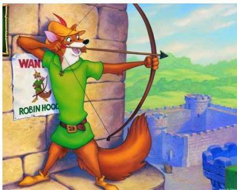
Fig. 1: Bild ur Disney's "Robin Hood" från 1973.

kontrasten mellan den enkle och obildade mannen av folket i förgrunden, och slottet med allt dess överdåd i bakgrunden. Man kan också spekulera i huruvida de höga stenmurarna som omger slottet är till för att enbart skydda kungen och adeln mot krigslystna fiender, eller om det kan vara så att den faktiskt är en konkret avgränsning mot arbetarna utanför. Kungar, adel och kyrkoherrar hade säkerligen mycket lite intresse av att beblanda sig med bönderna, och ansåg det antagligen vara bekvämast att i största möjliga mån isolera sig från dem. Det är en typ av segregering man kan se även idag år 2009, då s.k. gated communities blir allt vanligare, där de som har råd kan köpa sig en dyr bostad i ett område avgränsat med stängsel och vakter dygnet runt, för att obehöriga inte ska kunna överhuvudtaget passera genom området eller handla i eventuella affärer lokaliserade där.