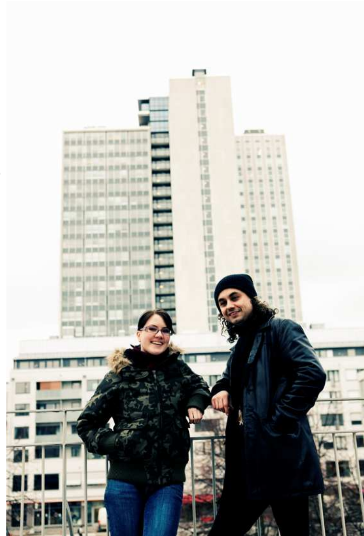
Studerande på skolans tak med Studentskrapan i bakgrunden.